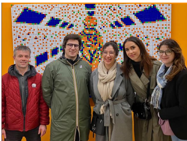
Des co-équipiers DJG Consulting, 2024

Le 1er juillet 2024 marque un tournant : les entreprises recommencent à planifier leurs recrutements pour septembre et octobre. Le marché boursier français a connu un rallye spectaculaire, renforçant la confiance des entreprises dans une reprise économique stable. La perspective d'une coalition politique modérée contribue également à cette stabilité, promettant peu de changements drastiques.